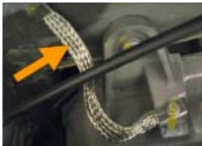
Tresse de masse, ne pas découper